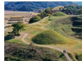
말이산 데이트 임재선