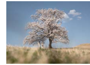
나무가 주는 행복 이상신