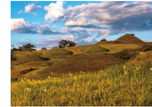
말이산고분의 오후 조봉래