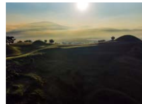
고요한 말이산의 아침 심태호