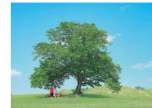
오래도록 함께하구려 조동제