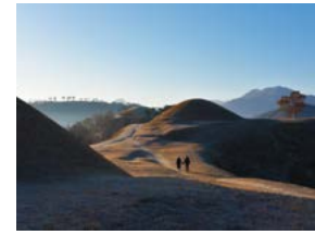
고분과 연인 김기만