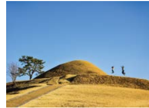
말이산의 추억 이영진