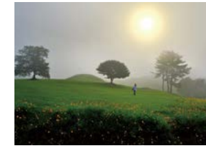
고분군의 아침 김택수