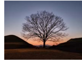
말이산고분 노을나무 박석우