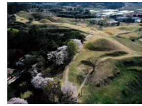
벚꽃 향기 가득한 말이산 문성식