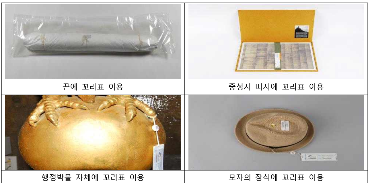
<그림 2> 재질별 등록번호 표기 예