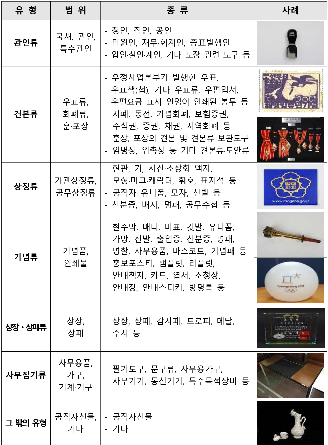
<표 2> 행정박물 유형별 분류