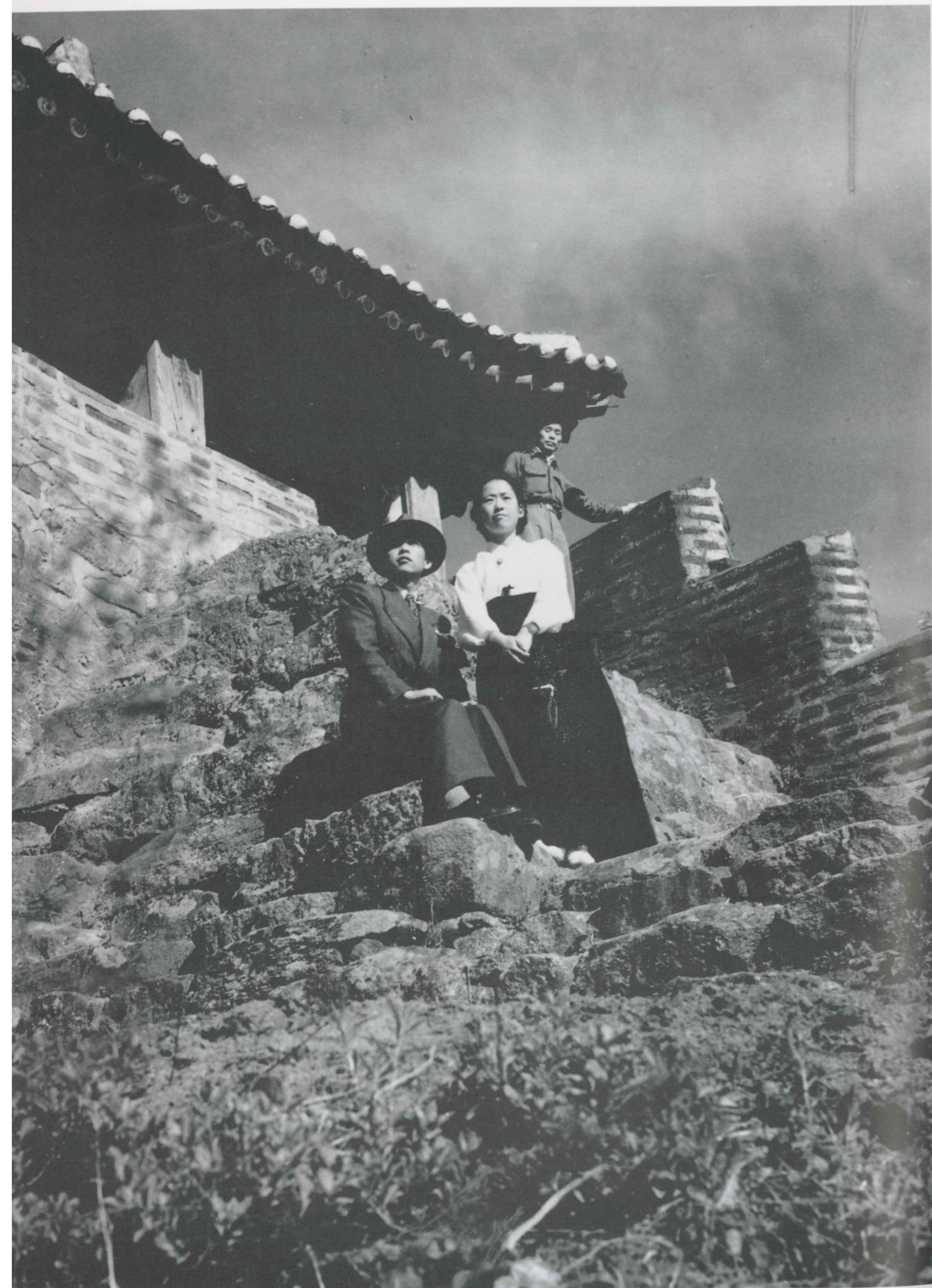
은 한쌍의 청춘남녀.(53. 5. 16)